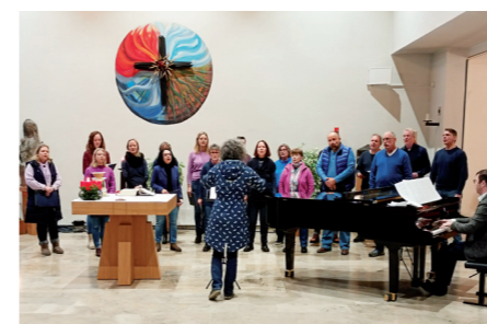
Minikoncert von chormatics in St. Gabriel Hainstadt 03.12.23