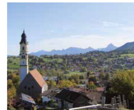
Mitgliederzeitung des Gesangsvereins Germania 03 Seligenstadt

Der Männerchor wird im Zeitraum 26.05. bis 29.05.2022 einen Ausflug ins wunderschöne Ostallgäu, nach Pfronten unternehmen. Aufgrund der freundlichen Empfehlung unseres Dirigenten Herrn Schnadt, wird die Reisegruppe vor Ort ist im „Haus Zaubenberg“ ( www.haus-zaubenberg.de ) untergebracht sein. Das kleine Familienhotel liegt im Ortsteil